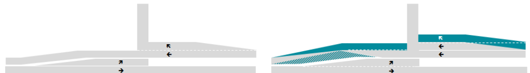
Figuur 1: Schematische weergave kruisingen N279.

In figuur 1 ziet u links de bestaande situatie bij de aansluitingen en ziet u rechts de verbetermaatregel (in blauw).