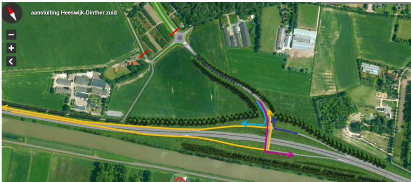
Figuur 2: Situatie aansluiting Heeswijk-Dinther Zuid vanaf 4 juli 2016