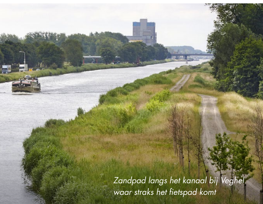
Zandpad langs het kanaal bij Veghel waar straks het fietspad komt

Voor iedereen die van fietsen houdt of die met de fiets naar school of het werk moet, zal het nieuwe fietspad tussen 's-Hertogenbosch en Veghel een fijne verbetering zijn. Het fietspad is in oktober 2015 al klaar. Bij de Runweg in Berlicum komt ook nog een fietsbrug over het kanaal. Maar die wordt pas in 2016 aangelegd.