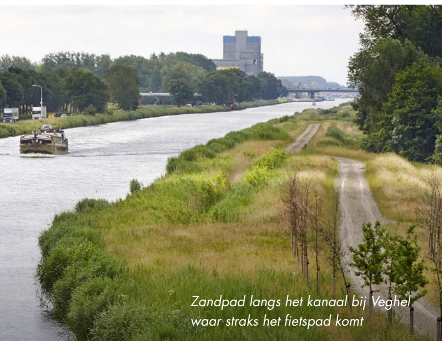
Zandpad langs het kanaal bij Veghel waar straks het fietspad komt

Voor iedereen die van fietsen houdt of die met de fiets naar school of het werk moet, zal het nieuwe fietspad tussen 's-Hertogenbosch en Veghel een fijne verbetering zijn. Het fietspad is in oktober 2015 al klaar. Bij de Runweg in Berlicum komt ook nog een fietsbrug over het kanaal. Maar die wordt pas in 2016 aangelegd.